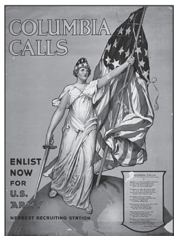
«Колумбія закликає». Американський плакат [1]