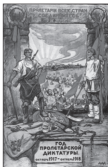
О. Аписит. Радянський плакат. 1918 р. [3]