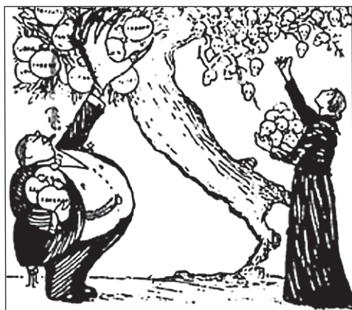
«Плоди війни». Карикатура з італійської газети «Аванті!» [5]

2. Розгляньте карикатуру «Плоди війни» і скажіть, чи такими безкорисливими були американці у цій війні? Свою відповідь обґрунтуйте.