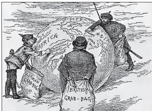
«Імперіалістичні мішечки». Американська карикатура [1]