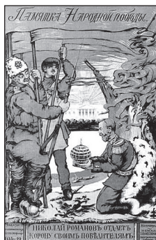
«Микола Романов віддає корону переможцям» [2]