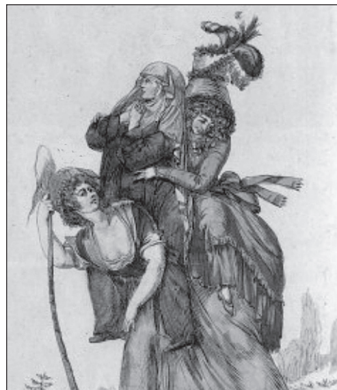
Французька карикатура XVIII ст. [2]