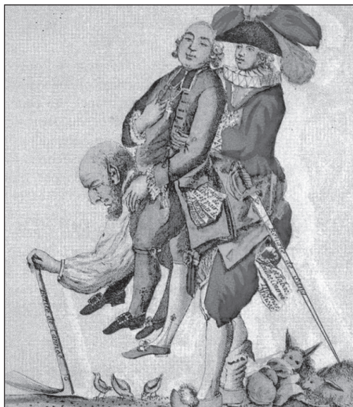
Французька карикатура XVIII ст. [1]