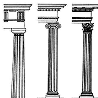
Доричний Іонічний Коринфський