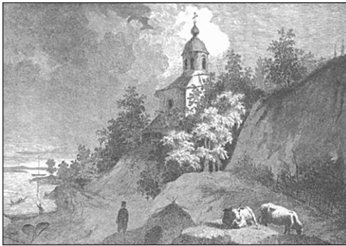
Т. Шевченко. Видубецький монастир. 1844