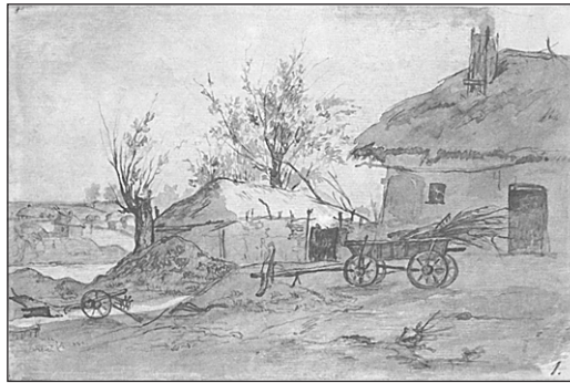
Т. Шевченко. Селянське подвір'я. 1845