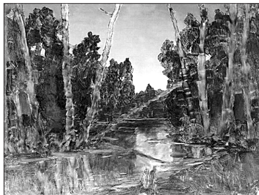
А. Куїнджі. Лісове болото

Про гостру спостережливість перших художників-анімалістів свідчать стилізовані фігури у пам'ятках звіриного стилю (у скіфів, кельтів, германців), у мистецтві Давнього Сходу, Африки, Океанії, Давньої Америки, в народній творчості багатьох країн. Зображення тварин зустрічаються також в античних скульптурі, вазописі та мозаїках; у середні віки в Європі були поширені алегоричні та фольклорні, казкові образи птахів і звірів. За часів Відродження з'явилися зображення тварин з натури, авторами яких були Антоніо Пізанелло , Альбрехт Дюрер . У Китаї художники-анімалісти з'явилися ще у VIII ст. ( Хань Хуан ), а в Європі — тільки у XVII ст. в Нідерландах ( Паулюс Поттер , Алберт Кейп ) і Фландрії ( Франс Снейдерс , Ян Фейт ), у XVIII ст. — у Франції ( Жан Батист Удрі ), Росії ( І. Гроот ). Яскравим представником, який працював у цьому жанрі, був біолог Василь Олексійович Ватагін (1883—1969). Усе своє життя він малював, ліпив, вирізав із дерева, висікав із каменю тварин.