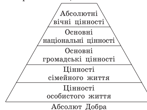
Рис. 3. Піраміда цінностей О. Вишневського

Основою всіх перелічених цінностей є Абсолют Добра (рис. 3):